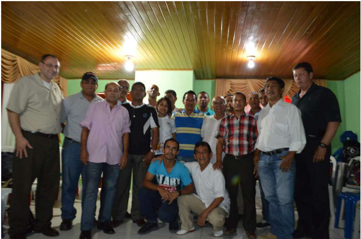
Grupo de hermanos en las conferencias en Barranquilla

Del 8 al 11 de nos trasladamos a la ciudad de Barranquilla (en la costa norte de Colombia), para dar las mismas conferencias a varios de los predicadores y hermanos de esta parte del país. Vieron hermano de Sahagún, Lórica, Valledupar, Barranquilla.